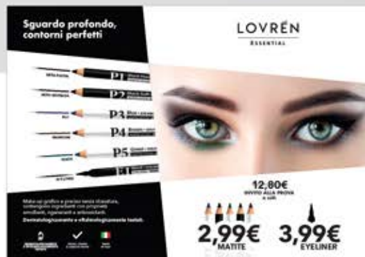
Cartello vetrina 100 cm x 70 cm