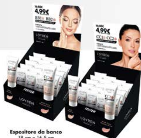
Espositore da banco 18 cm x 16,5 cm