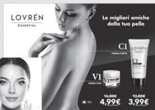
Cartello vetrina 100 cm x 70 cm