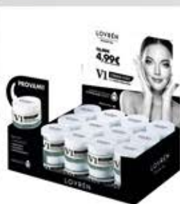
Espositore da banco 21,5 cm x 16 cm