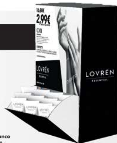
Espositore da banco 18 cm x 16,5 cm