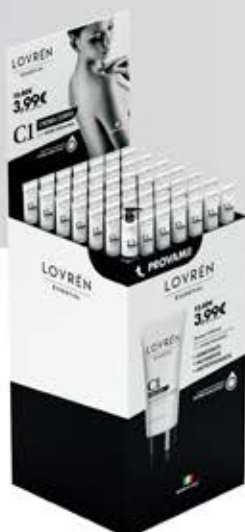
Espositore da terra 38 cm x 38 cm