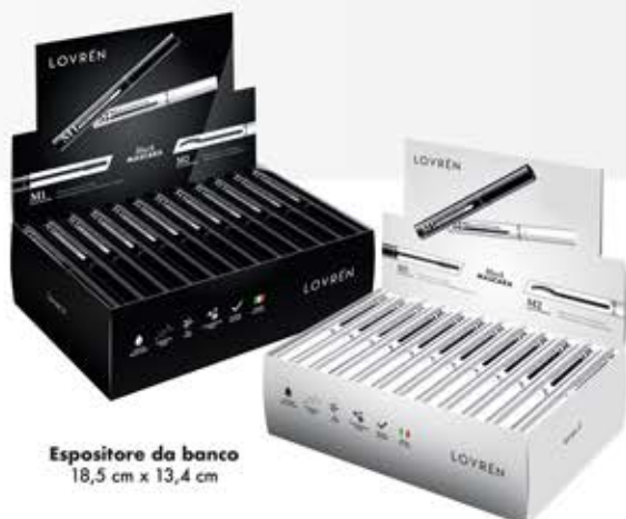
Espositore da banco 18,5 cm x 13,4 cm

DERMATOLOGICAMENTE E OFTALMOLOGICAMENTE TESTATO