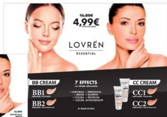
Cartello vetrina 100 cm x 70 cm